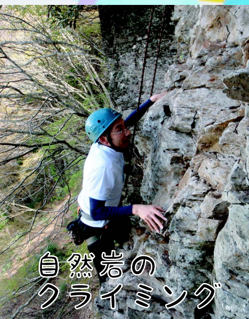
自然岩の クライミング